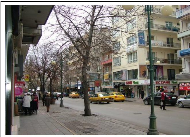
Tunalı Hilmi caddesi

Tunalı 是靠近 kızılây 的一個鬧區，也是 Tunalı TÖMER 所在的地方。