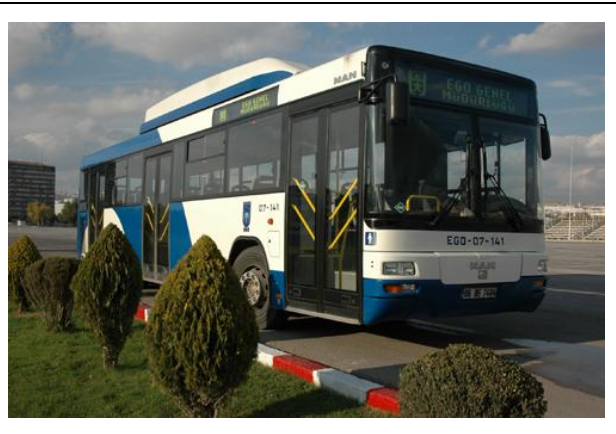
Havaş 10 YTL