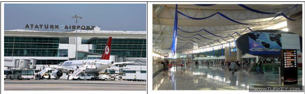
İstanbul – Atatürk Havalimanı