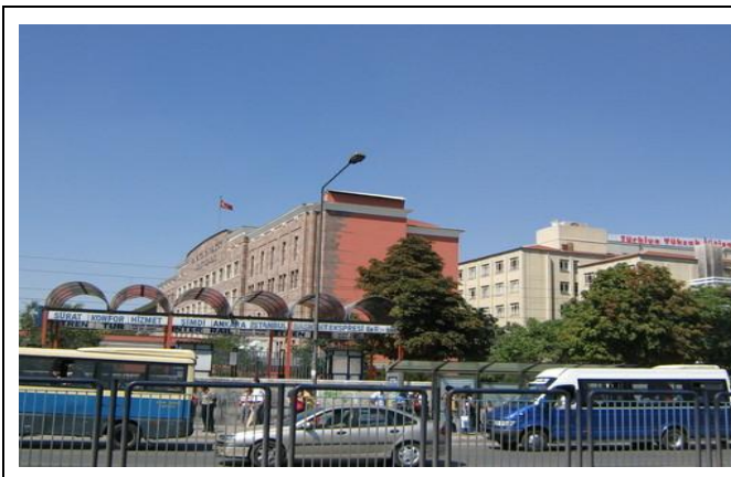
Sıhhiye 橋，亦可在此搭 dolmuş 回學校

往 Sıhhiye 方向的車為 SM =Sıhhiye-Merkez，會在 Sıhhiye köprüsü 下車，步行即可到達 kızılây。