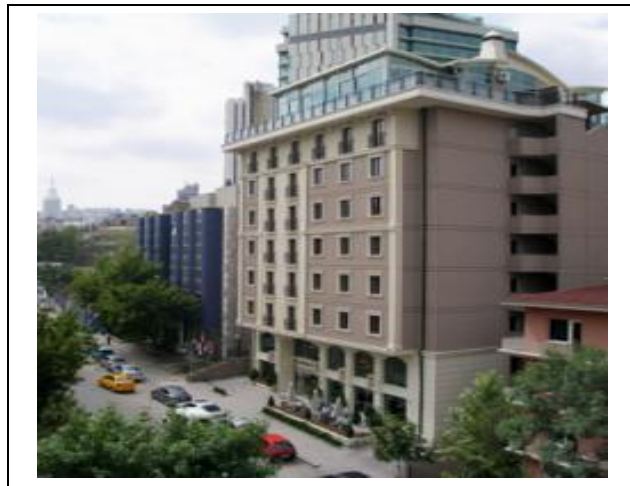
Tunus Caddesi (往前走即為站牌)

Tunalı 是靠近 kızılây 的一個鬧區，也是 Tunalı TÖMER 所在的地方。